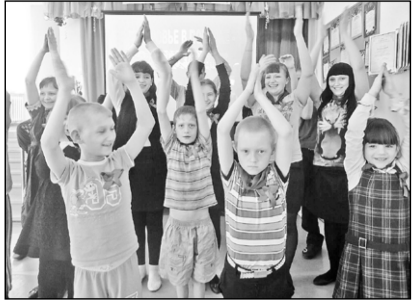
Ребята поняли: делать зарядку – это интересно, весело и полезно

Седьмого апреля в Казанской коррекционной школе проходила открытая профилактическая акция «Областная зарядка», участниками которой стали учащиеся со 2 по 9 класс и весь педагогический коллектив. Мероприятие началось с торжественного построения. Затем ведущие рассказали о пользе занятий спортом и пригласили всех на зарядку, которая продолжилась увлекательными танцами. Дружеская атмосфера мероприятия сплотила всех его участников.