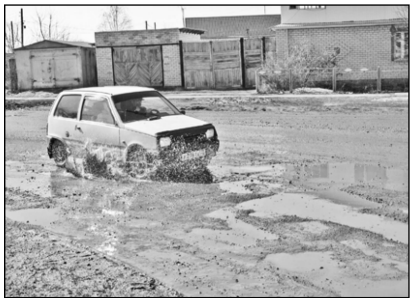
Ох уж эти дороги! Сел за руль и... поскакал