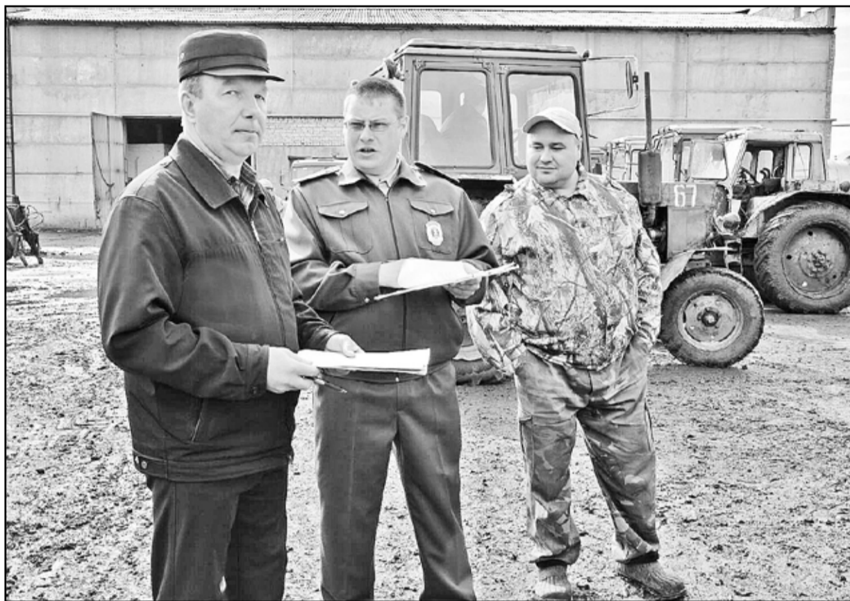
Своевременное прохождение техосмотра – гарантия того, что техника будет эксплуатироваться безопасно

Технический осмотр машин проводится ежегодно перед началом полевых работ. Основной его целью является проверка технического состояния тракторов, самоходных и иных машин, а также прицепов к ним, их соответствие требованиям, касающимся безопасности жизни и здоровья людей, сохранности имущества и охраны окружающей среды. Уточняется количество машин в сельхозпредприятии, их принадлежность, регистрационные данные.