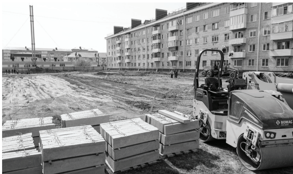
Строители подготовили площадку под благоустройство, впереди еще много работы.