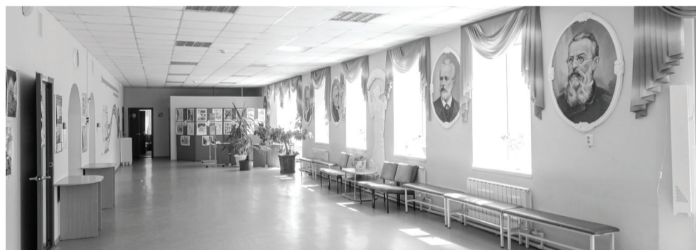
Помещения школы искусств «Мир талантов» будут обновлять поэтапно. В этом году отремонтируют хореографические залы.

В детской школе искусств «Мир талантов» идет ремонт.