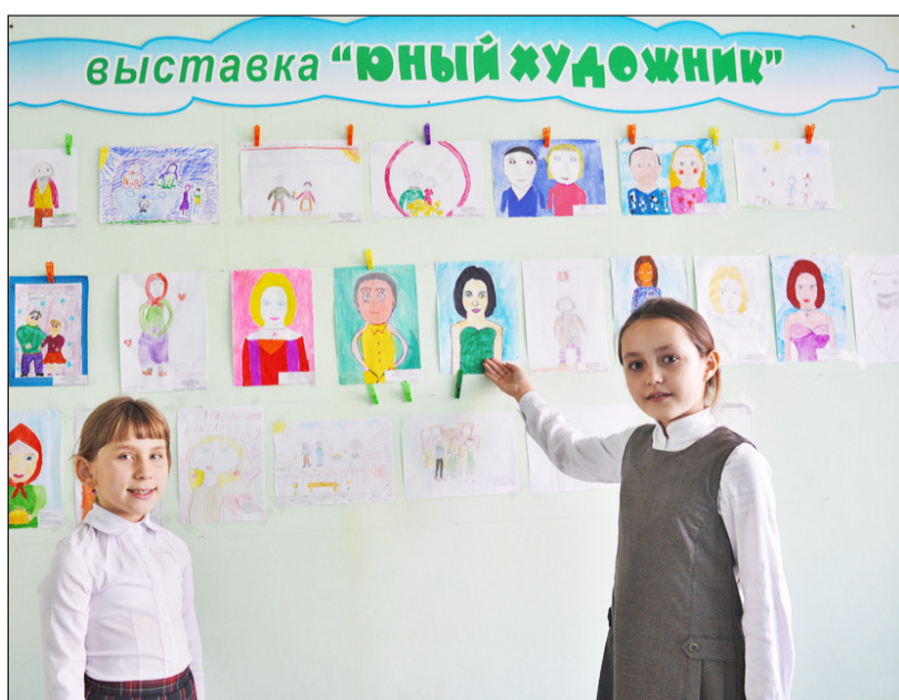
Бабушки и дедушки глазами самых внимательных наблюдателей