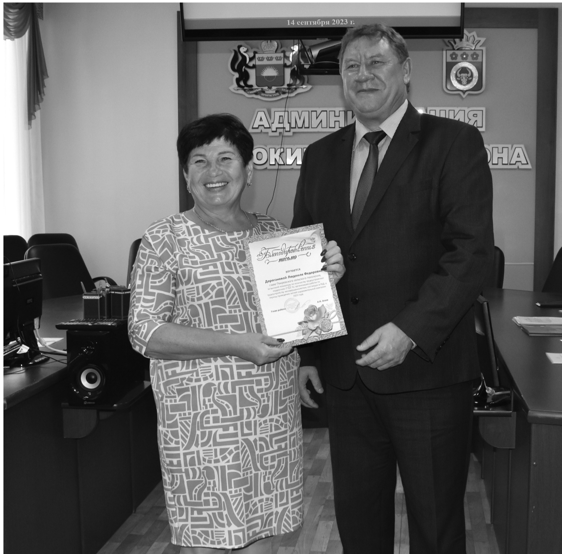
Благодарственные письма получили главы поселений

За результативное участие в конкурсе "Добро пожаловать!" лагерей дневного пребывания детей, организацию экскурсий для отдыхающих в лагере, активное