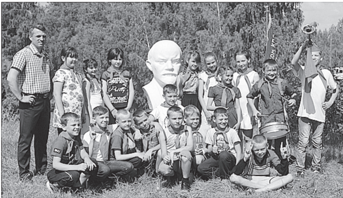
И ребята, и взрослые с удовольствием участвовали в фотосъёмках, представляя себя в роли пионеров и туристов

Нынешние отдыхающие, как и те, кто проводил здесь каникулы 10, 20 и больше лет назад, навсегда сохраняют в сердцах искреннюю любовь к «Спутнику», в котором каждый оставляет частичку своей души.