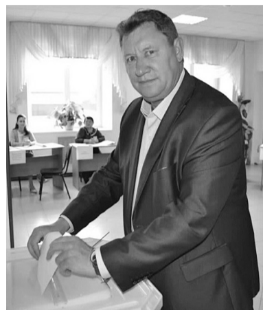
Голосует глава района. Интересно – за кого?