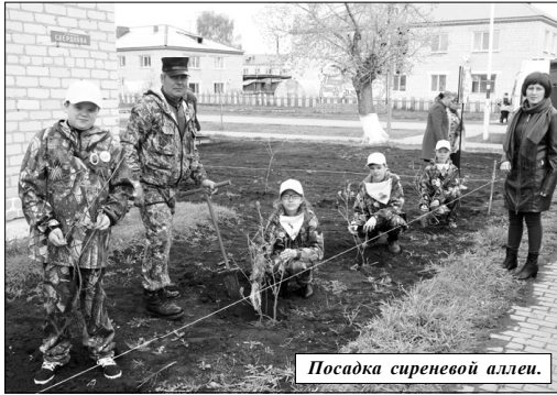
Посадка сиреневой аллеи.

шими охотками этих пахучих цветов в мае 1945 года встречали советских воинов-освободителей в каждом городе, в каждом поселке.