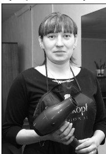
Еще несколько лет назад трудно было предположить, что можно открыть свое