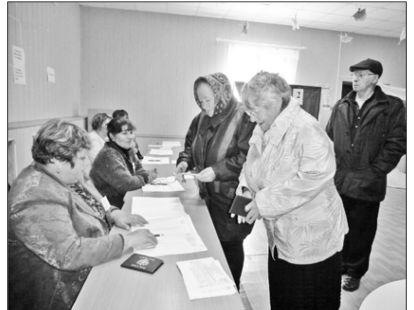
Пенсионеры — люди активные и сознательные

Тот, кто проголосовал, спешил посмотреть экспонаты выставки «Золотая осень». В ней приняли активное участие работники местных детских садов, школы, члены ветеранского клуба «Домашняя академия», работающего при ДК. Поразительно,