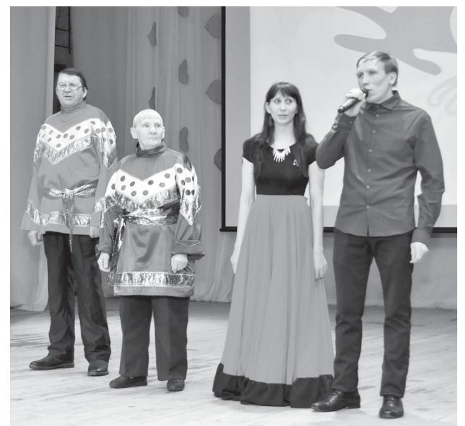
Творческий коллектив Яркоковского дома-интерната

Но, пожалуй, самым главным для собравшихся в зале были атмосфера единения и возможность общения друг с другом, когда можно поделиться радостями и сомне-