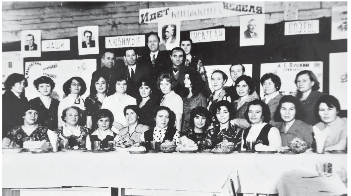
Педколлектив школы-интерната, 70-е годы XX века