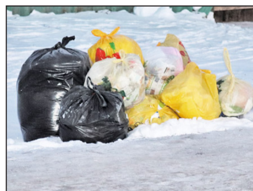
Так выглядит мешочный способ сбора мусора. Не совсем этично, но зато практично

способе сбора мусора. В дальнейшем, по мере реализации данной программы, будет развиваться целая инфраструктура, к примеру, организация специальных площадок с твёрдым покрытием, установлением на них современных экологически безвредных контейнеров, строительство мусоросортировочных заводов на территории региона. Один из них планируется построить и запустить в эксплуатацию в городе Ишиме в 2024 году, ликвидировав к этому времени все полигоны твёрдых бытовых отходов. Бесспорно, отходы жизнедеятельности должны подвергаться переработке, как это организовано в других цивилизованных странах, а не закапыванию, что только увеличивает экологическую нагрузку на окружающую среду.