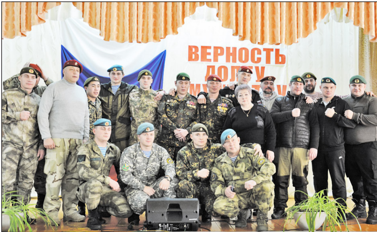
Вот они – достойные сыны Отечества. Как сказали гости из других регионов, аналога мероприятию, на которое их пригласили, они нигде больше не встречали, а потому попросили сделать общий снимок на память