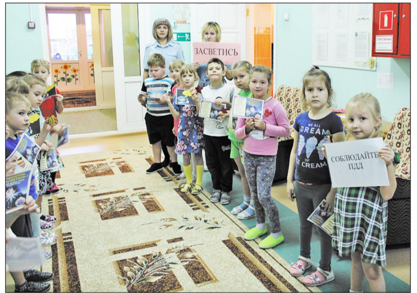
Правила безопасности на дороге нужно знать с детсадовского возраста

Сотрудники Госавтоинспекции провели с воспитанниками подготовительной группы Новоселёвского детского сада «Колокольчик» специальные занятия, на которых продемонстрировали свойства специальной светоотражающей плёнки. Дошколята узнали о видах современных световозвращателей, свойствах и правилах их ношения. После чего малыши самостоятельно изготовили светоотражатели из специального материала. В вечернее время юные дизайнеры вручили световозвращатели собственного изготовления родителям и воспитанникам из других групп детского сада. Ребята рассказывали о важности ношения световозвращателей на верхней одежде в тёмное время суток. Взрослые внимательно слушали детей и обещали им выполнять все правила дорожного движения.