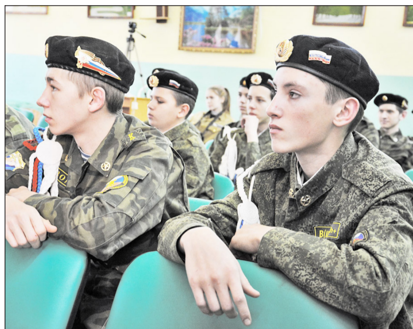
На уроке мужества ребята старались не пропустить ни одного слова, сказанного ветеранами