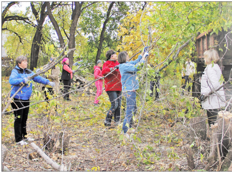
Когда все вместе, и дело спорится

Со временем без проворных заботливых детских рук школьное детище зачахло. Ароматные плодоносы состарились, а участок затянуло бурьяном, сквозь который прорезались хлесткие прутья тала. Из-за стихийного произрастания колкой поросли на территории парка, что называется, было ни пройти ни проехать. Мало того, сухостой в парке мог стать, так сказать, бомбой замедленного действия для окружающего жилого сектора, создавая возможность возникновения пожароопасной обстановки. В настоящий момент при помощи коллективного труда добрая половина территории приведена в божекий вид: выпилены дряхлые деревья, убран трухлявый растительный хлам. Левый фланг парка уже находится в при-