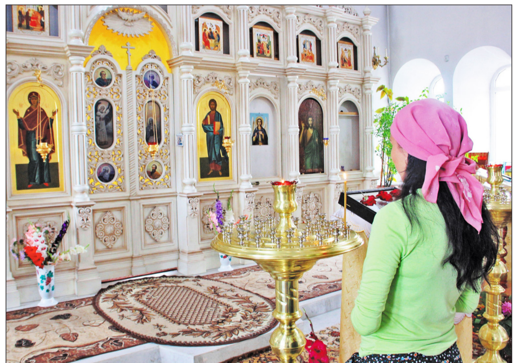
Молиться можно везде и всегда, но говорят, что всё же церковная молитва выше домашней

Пресс-служба филиала «Урало-Сибирский региональный центр» ФГУП «Российская телевизионная радиовещательная сеть»