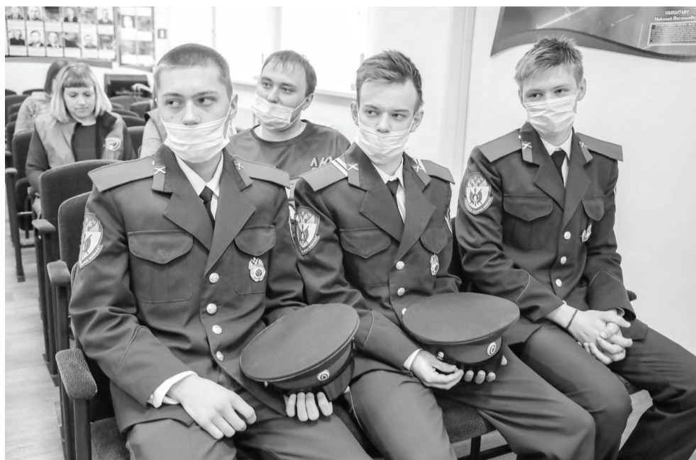
Ишимские казачата – неперенные участники патриотических мероприятий. Так, вернувшись из Анапы, ребята встретились с ветеранами организации «Память сердца» и выразили им благодарность за сохранение воспоминаний о солдатах Великой Отечественной войны.

– Наше направление отличается от кадетских классов – мы изучаем историю, культуру и традиции казачества. В Анапе у нас были встречи с представителями кубанского, донского каза-