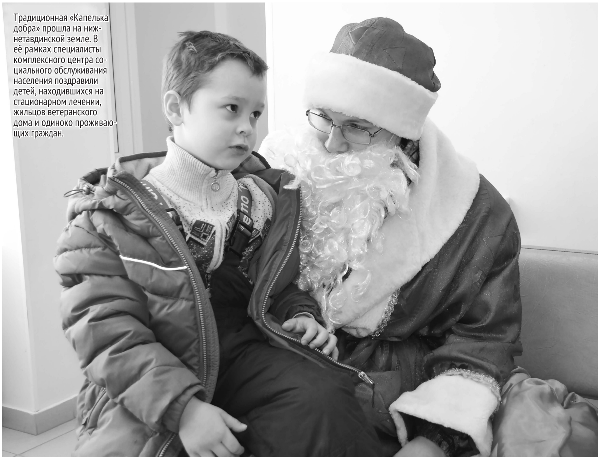
Дети, оказавшиеся в больнице по воле случая, тоже не остались без подарков и внимания Деда Мороза.

Традиционная «Капелька добра» прошла на нижнетавдинской земле. В её рамках специалисты комплексного центра социального обслуживания населения поздравили детей, находившихся на стационарном лечении, жильцов ветеранского дома и одиноко проживающих граждан.