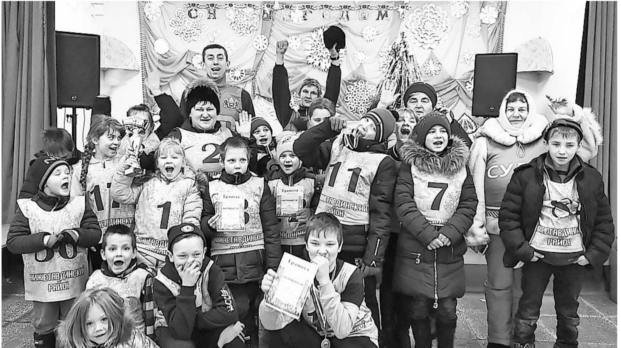
Участники зимних весёлых стартов «Папа, мама, я – спортивная семья» в посёлке Берёзовка.

В Нижнетавдинском районе проводили старый год и встретили новый по-спортивному