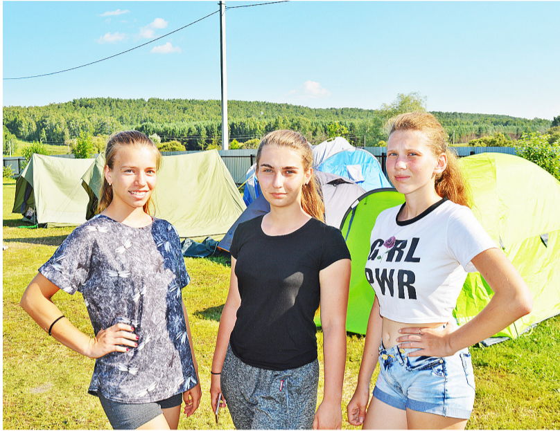
В окрестностях Боровлянки можно отлично организовать свой досуг, даже проживая в палатках

Одним из уникальных мест в Тюменской области является город Тобольск, в котором ощущается сила, святость, величие. Здесь находится единственный в Сибири каменный кремль – музей под открытым небом. Об этом месте ходят таинственные легенды, которые привлекают не только российских, но и зарубежных туристов. На территории кремля расположено 11 музеев-