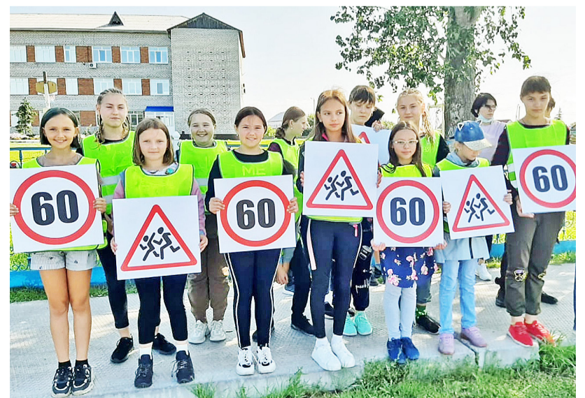
Ребята надеются, что взрослые их услышали и поняли