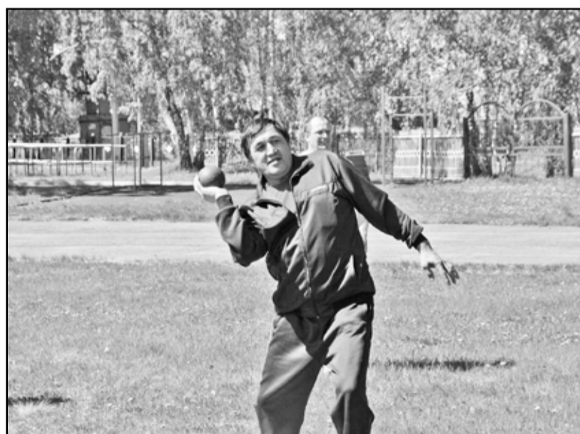
В метании ядра главное – сила и координация

Соревнования проводились по следующим видам спорта: лёгкая атлетика (бег на 60, 100 метров, толкание ядра, прыжки в длину с разбега), армспорт, шахматы, дартс,