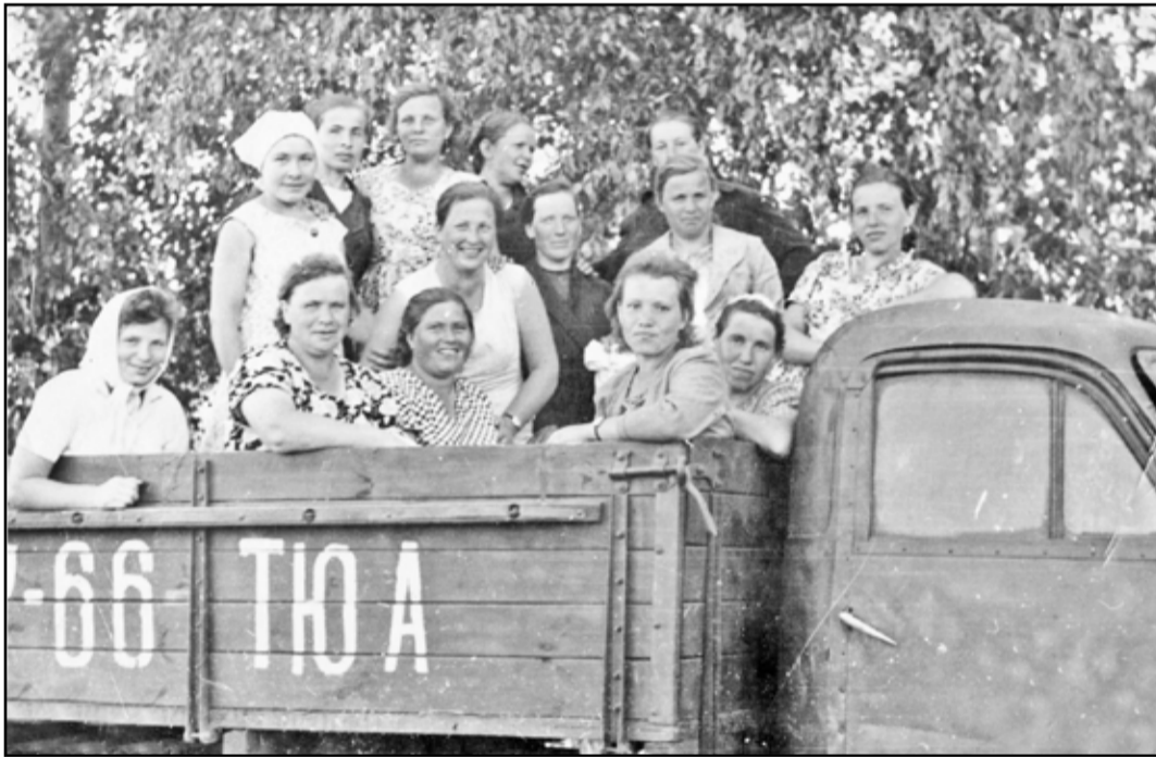
Коллектив швей едет на сенокос помогать колхозу. 1964 г.