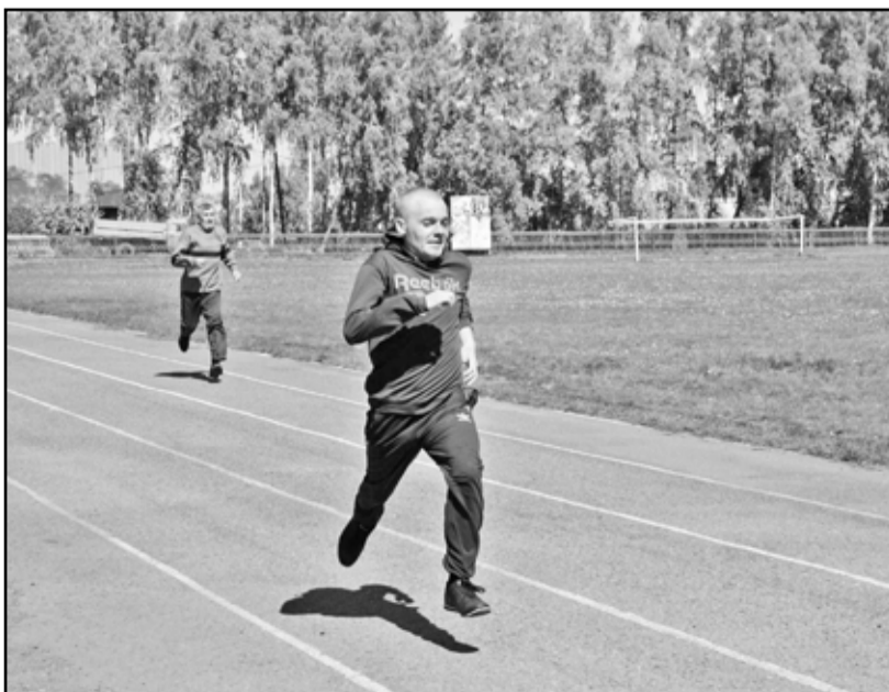
Вперёд – к победе!

– Я участвую в соревнованиях по прыжкам в длину и дартсу. Настроение отличное, здесь, на соревнованиях, заряжаешься оптимизмом и радостью. Желаю всем больше улыбок и никогда не сдаваться.