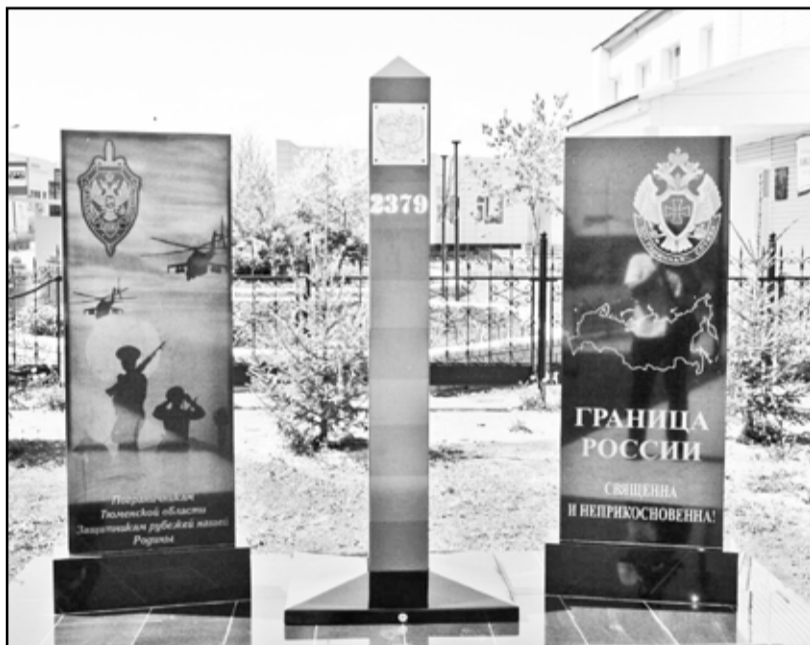
Недавно установленный памятник пограничникам в селе Казанском

ставляет собой две плиты из чёрного мрамора, на одной из которых изображена карта России, эмблема пограничной службы и надпись: «Граница России священна и неприкосновенна!» На другой – изображён пограничный дозор с собакой и летящий вдаль вертолётный патруль. Здесь такая надпись: «Пограничникам Тюменской области – защитникам рубежей нашей Родины». Дополняет мемориаль-