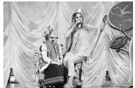
На снимках: фрагменты спектакля "Снежная королева".