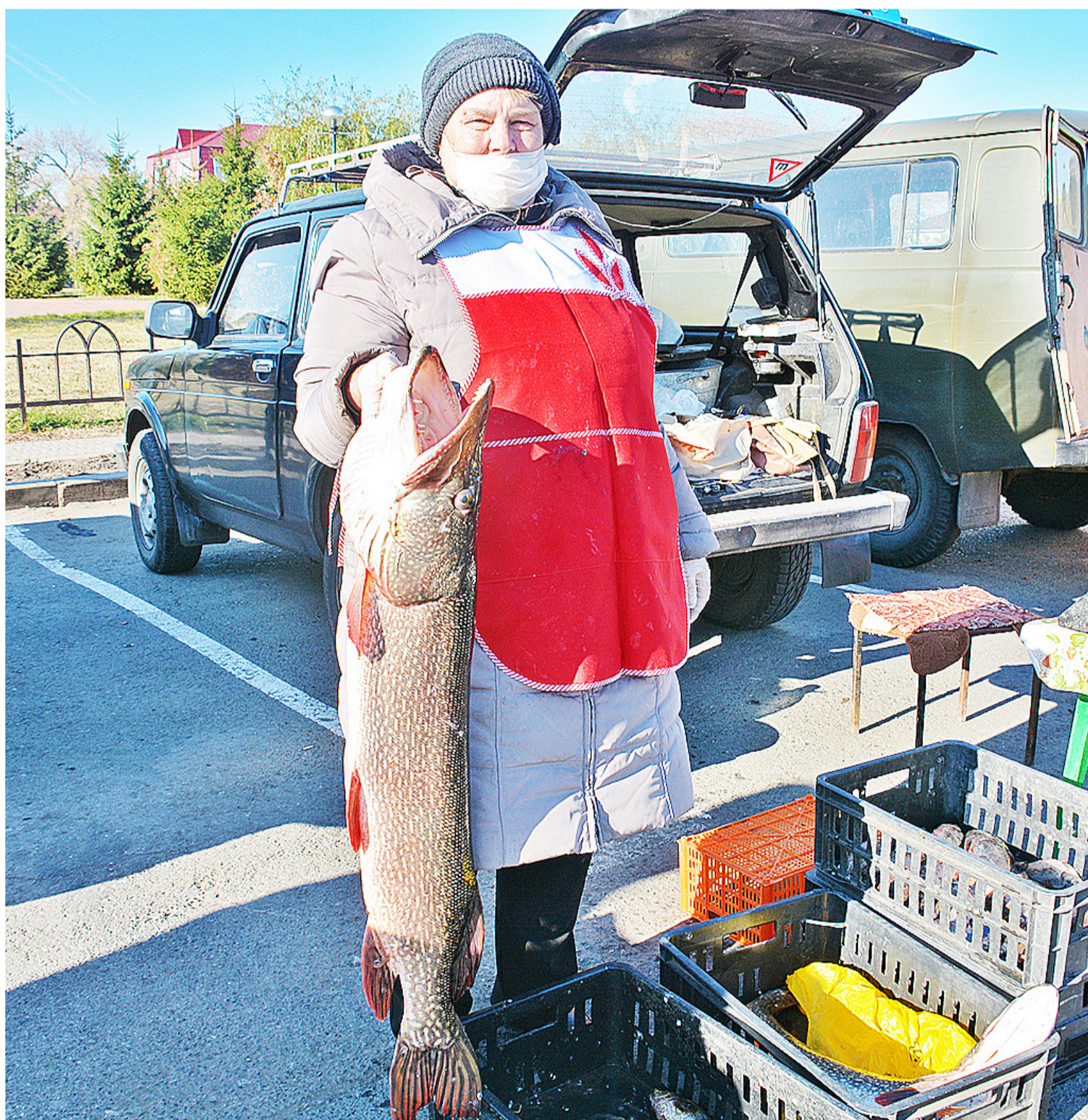
Восьмиклограммовыми щуками удивляли казанские рыболовы

В субботний день, 9 октября, в селе Казанском состоялась ярмарка «Осень-2021»