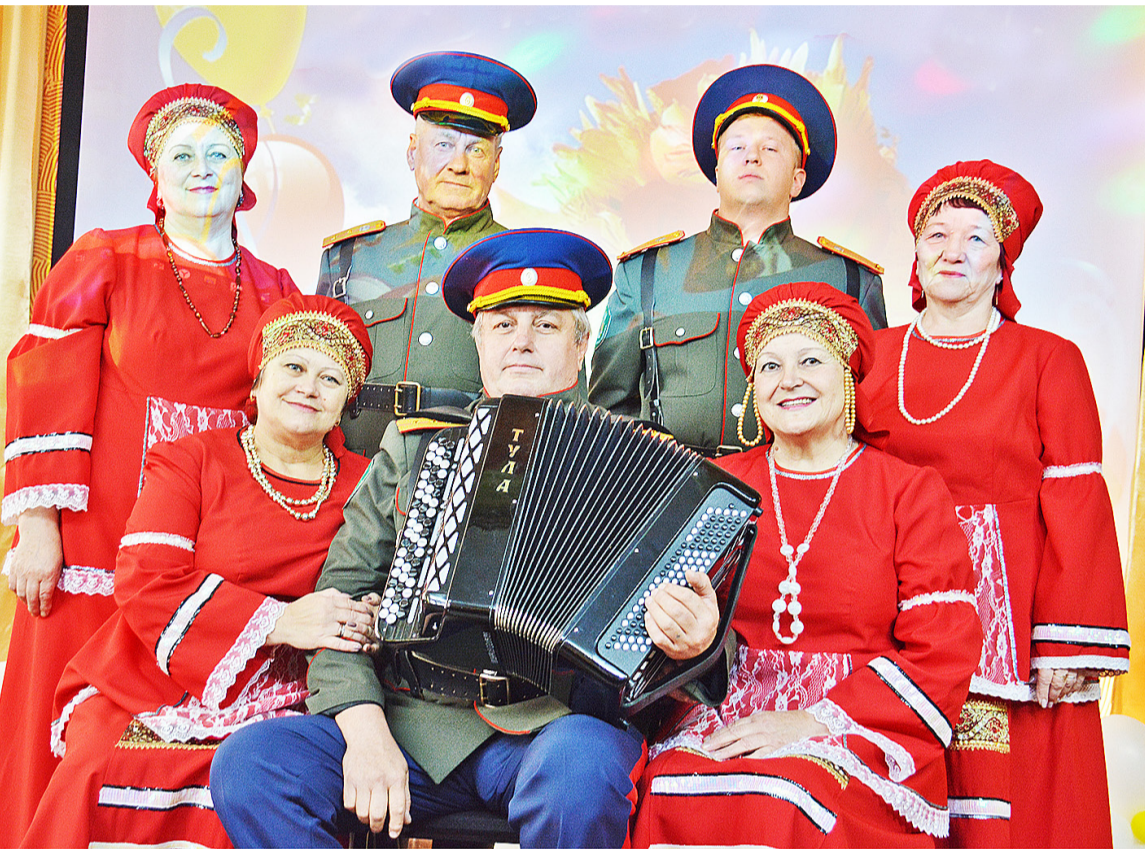
В творческий коллектив «Хуторяне» входят идейные, добродушные и талантливые артисты