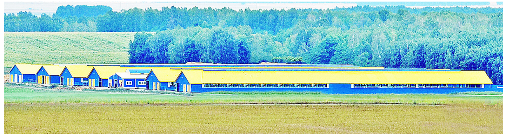
Молочнотоварная ферма в деревне Шагало-во

Агрокомплекс ведёт активное сотрудничество с Уральским научно-исследовательским институтом сельского хозяйства. В результате испытываются и ис-