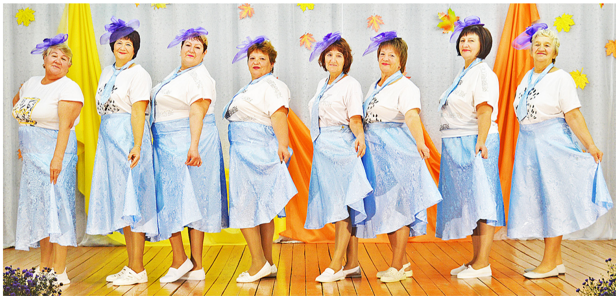
Выступления танцевального коллектива «Сельские зори» пользуются большим успехом у зрителей