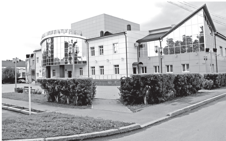
• Во Дворце культуры на улице Вокзальной в городе сегодня можно и кино посмотреть, и на концертах заводоуковских талантов побывать, и гастроли заезжих звёзд посетить. А кружки и творческие объединения ждут земляков в этих стенах, почитай, каждый день.