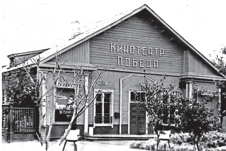
• «Скоро на экране!» Мальчишки и девчонки со всего города бежали на улицу Вокзальную, чтобы узнать, какой фильм будут «крутить» в кинотеатре «Победа».

Алексей СЕВОСТЬЯНОВ