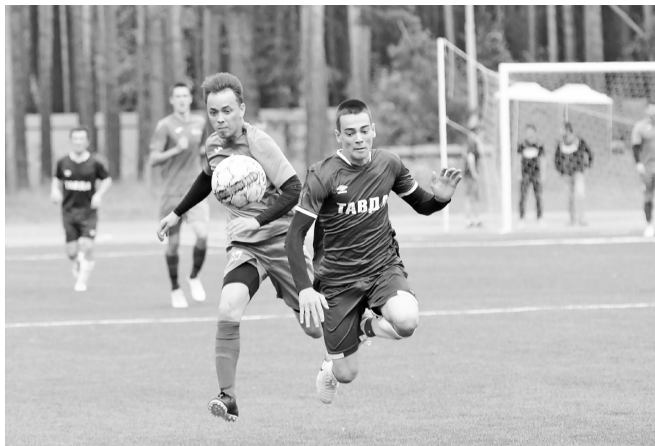
Во второй половине матча стало много борьбы, а свисток арбитра начал звучать чаще. Радует, что спортсмены обошлись без травм и повреждений.

Второй игровой отрезок начался опасным розыгрышем углового удара у ворот гостей. Ялуторовские футболисты отбились и убежали в контратаку, венцом которой стал выход один на один. Здесь свой класс показал наш вратарь,