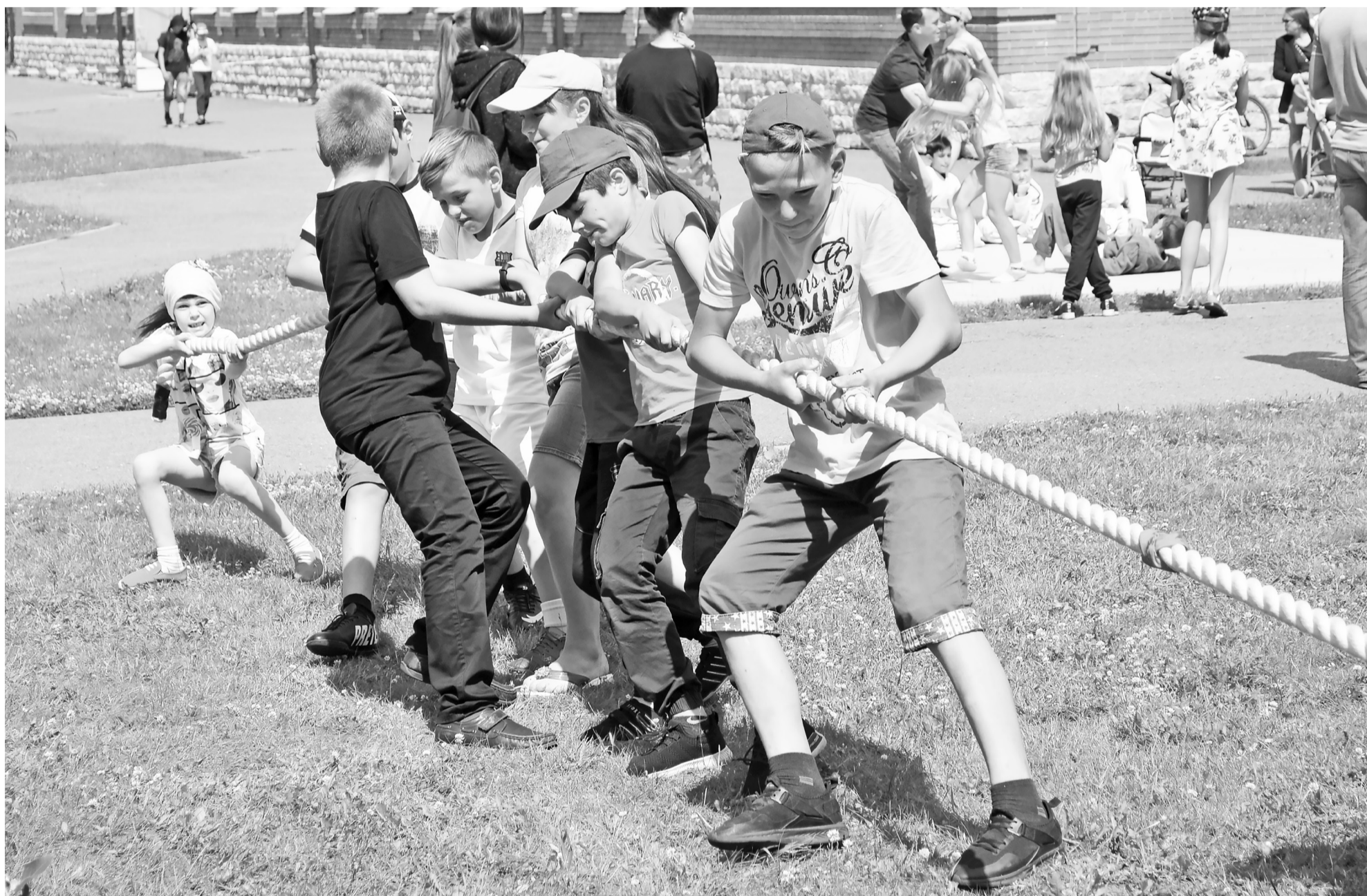
Яркие мгновения проносящегося мимо лета: не диван и телевизор, а улица и спортивные состязания останутся в памяти. Не упusti своё лето! Ещё целая половина!

Оздоровительные лагеря приняли заключительную смену