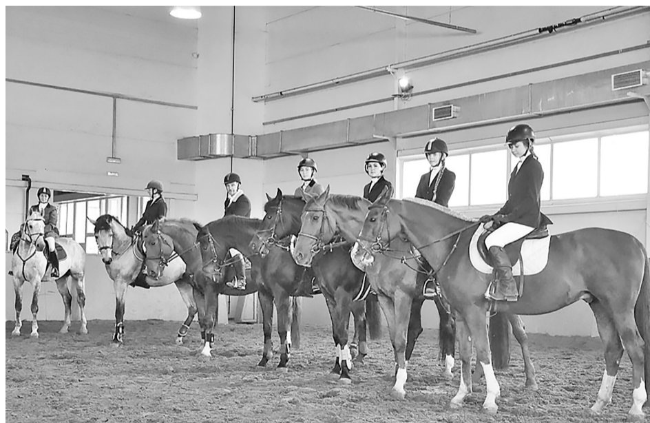
Жизнь под манежем кипит: спортивные пары готовы к очередной тренировке.

чонки проходят общий курс для начинающего спортсмена: изучают анатомию лошади, её происхождение, строение снаряжения. Также мы учим детей ухаживать за лошадьми, по внешним признакам узнавать об их самочувствии.