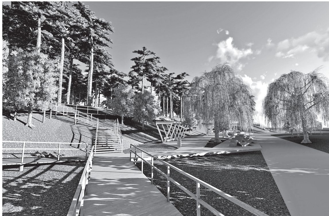
• Вот так в проекте выглядит набережная у водоёма в центральном парке Заводоуковска.