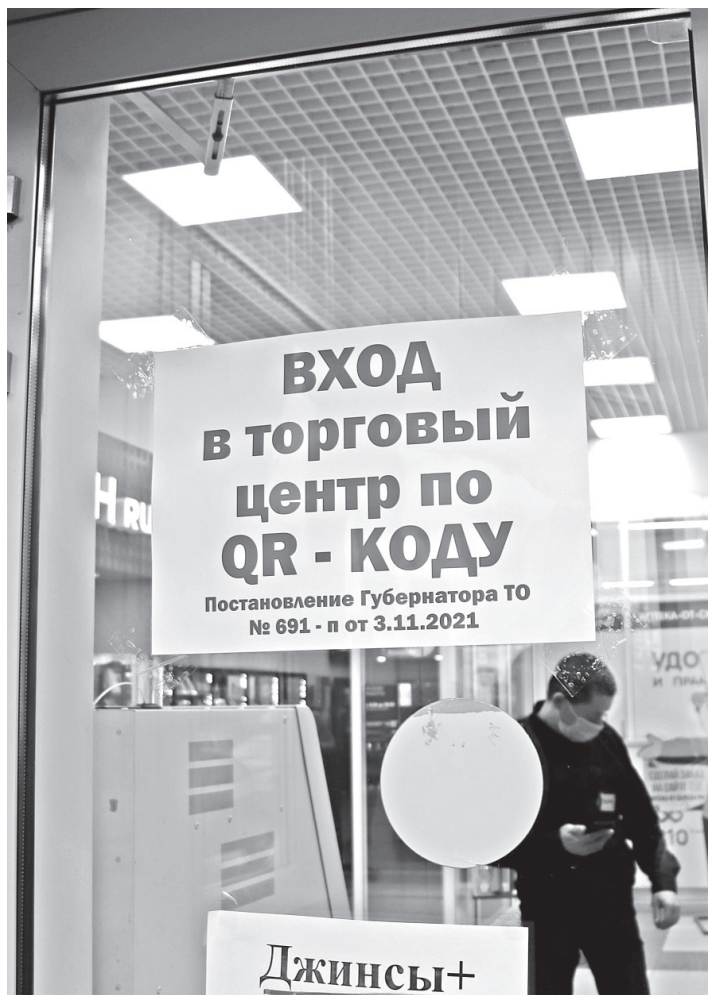
• В крупных магазинах Заводоуковска служба охраны на входе требует от посетителей предъявить QR-код, который можно считать с помощью обычного телефона и специального приложения.

С 3 декабря в Тюменской области расширили список общественных мест, доступных для посещения по QR-кодам. Изменения внесены в постановление регионального правительства № 120-п, документ подписал глава региона Александр Моор.