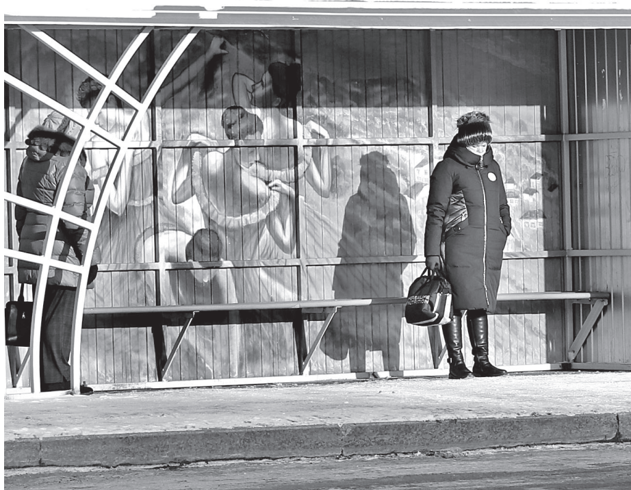
• «Голубые танцовщицы» Эдгара Дега привнесли ощущение театральной атмосферы остановочному павильону «Шулаверы» в городе.

На остановке «Шулаверы» в Заводоуковске с лета красуются «Голубые танцовщицы» французского художника Эдгара Дега. Этот шедевр мировой живописи появился на павильоне общественного транспорта благодаря проекту по преобразованию города.