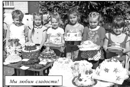
Мы любим сладости!