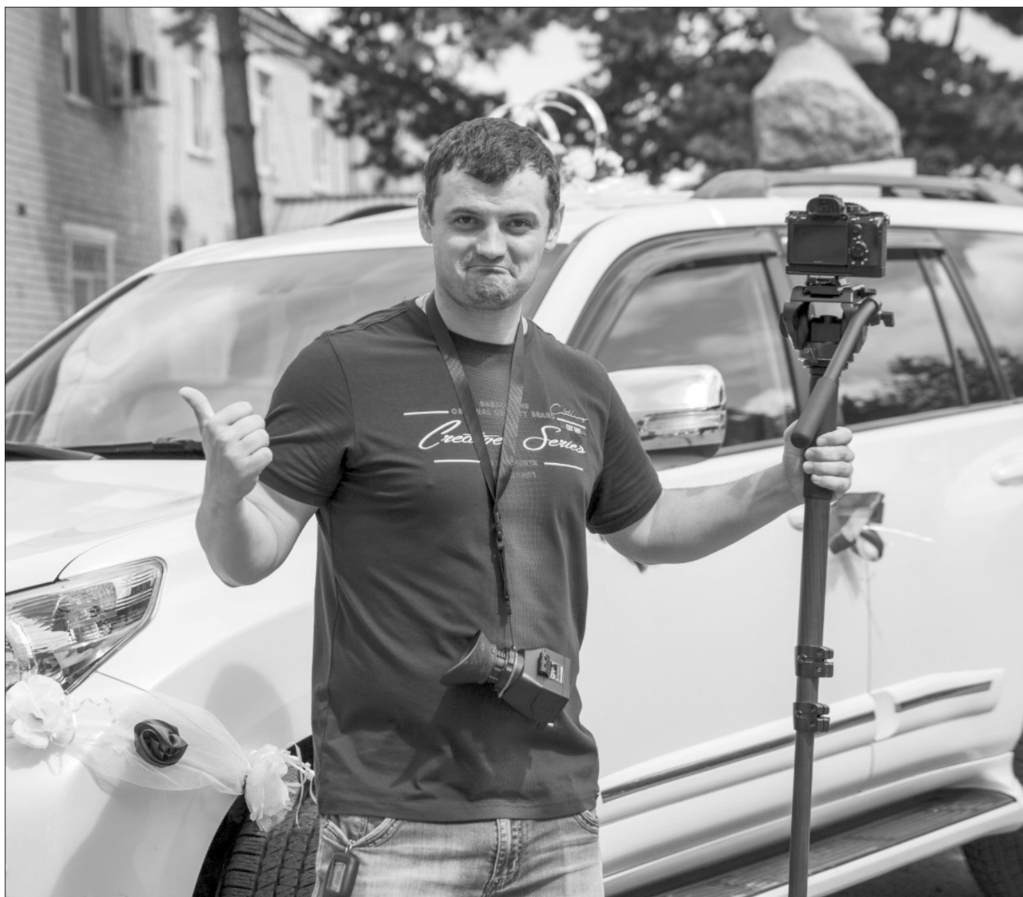
С весны до осени у фотографа самое напряженное время