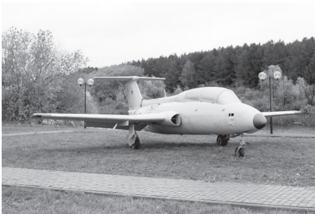
Корпус стальной птицы на набережной Ишимчика – и городской арт-объект, и маркер памяти о славной истории Ишима военных лет.

Процесс благоустройства городского общественного пространства – второй набережной – продолжается.