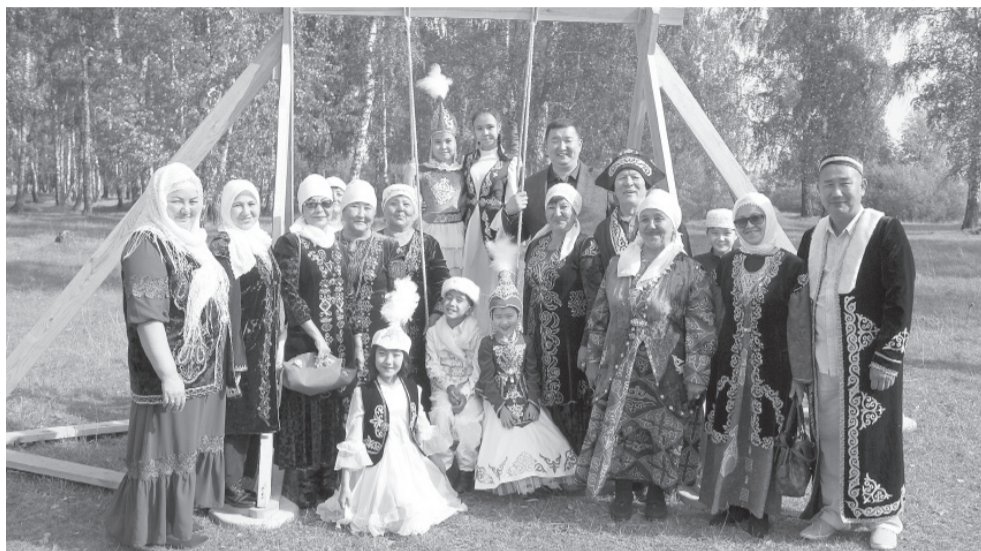
По мнению всех участников, съёмки удалась на славу. Часть областного фильма «Казахи Сибири» будет весомой, зрелищной, раскрывающей лучшие национальные черты.