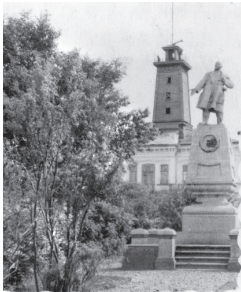
Ростовой памятник В.И. Ленину на постаменте 1925 года. Июль 1950 г.

Позади трактора ехала вереница телег, в которых находились фигуры, изображавшие остатки старого, дореформенного быта в виде вредителей сельского хозяйства, начиная с попа и кончая генералом, кулаками, буржуем и замызганной фигурой отживающего своё время трёхполья.