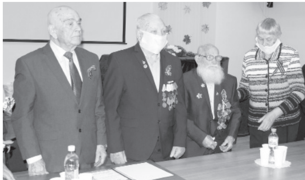
Помнит сердце, не забудет никогда: в городском совете ветеранов в формате литературно-музыкальной гостиной прошло мероприятие, посвящённое 75-летию Победы.

Активно участвуют в реализации областного проекта «Диалог поколений» слушатели «Университета третьего