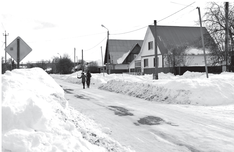
• Сегодня только название улицы Аэродромной напоминает о том, что в годы Великой Отечественной войны здесь была заводская взлётная полоса.